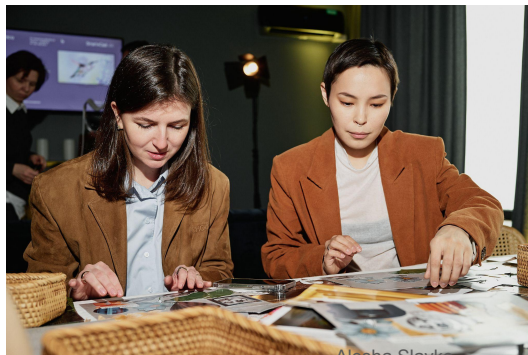
ask_marysia TG: 11K IG: 29,4K