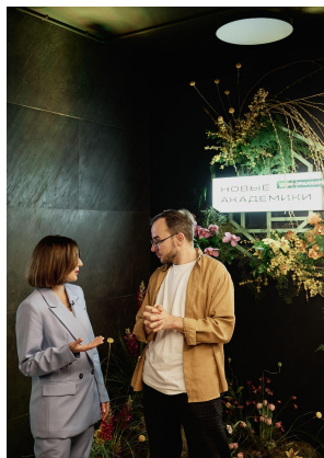
Задвижки по недвижке Youtube+TG: 15,2K