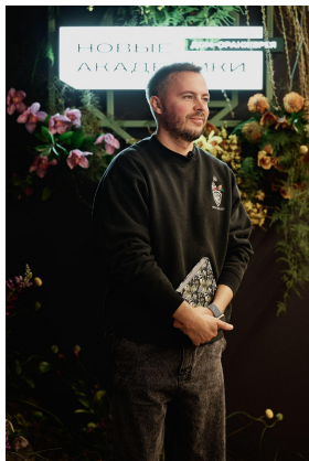
136th IG: 170K

Фотоотчет: Y:\PR Главстрой_Банк данных_PR\07. Фото\Новые Академики\Старт Новые Академики_Гости