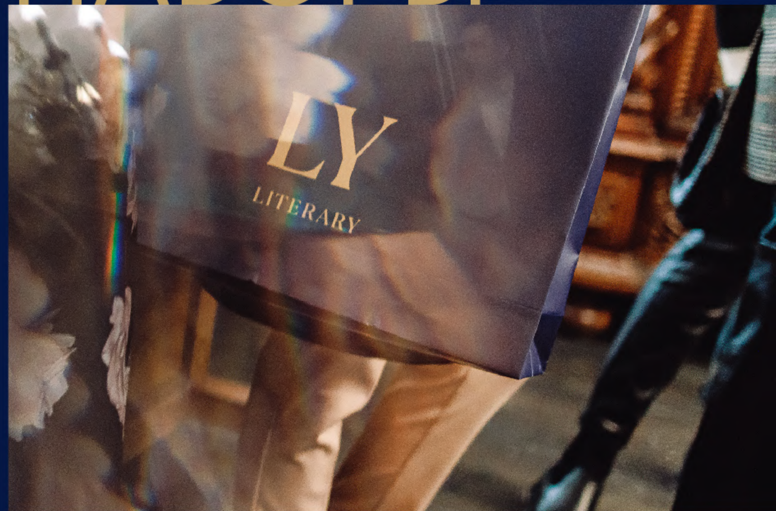
БУКЛЕТ КЛУБНОГО ДОМА