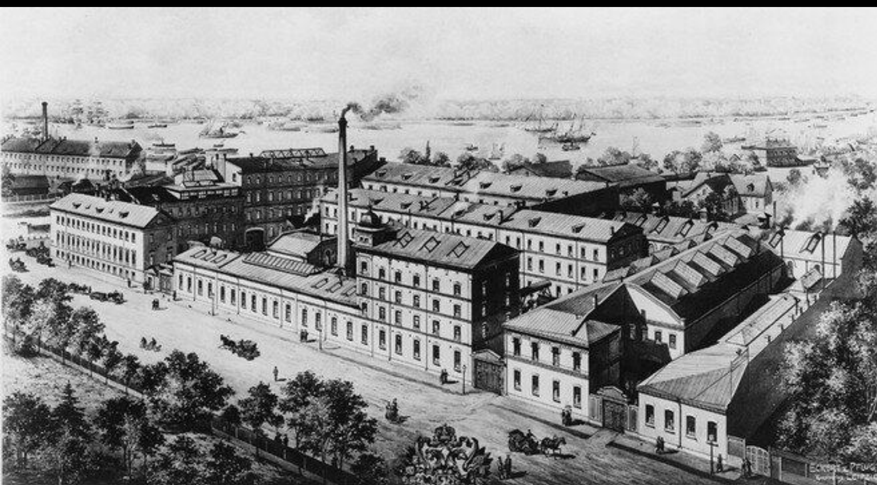
АКЦИОНЕРНОЕ ОБЩЕСТВО РУССКИХЪ ЭЛЕКТРОТЕХНИЧЕСКИХЪ ЗАВОДОВЪ СИМЕНСЪ и ГАЛЬСКЕ, С-ПЕТЕРБУРГЪ.

В советские годы на территории, где строится новый ЖК, был завод Козицкого , на котором выпускали телевизоры «Радуга» . А само предприятие было построено немцами еще в царские годы, тогда оно называлось «Сименс и Гальске». Отсюда и отсылка к немецкому языку ( Regenbogen, «радуга» с немецкого ), и к прежнему производству.