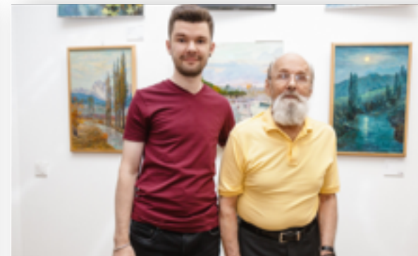
Пожилые родители, дедушки и бабушки