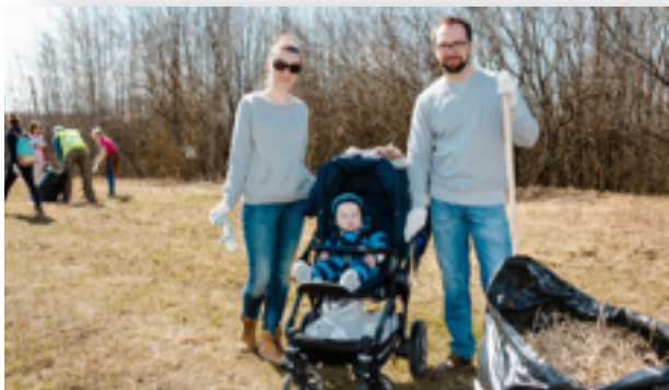
Мамы и папы с маленькими детьми и без детей 25-35 лет