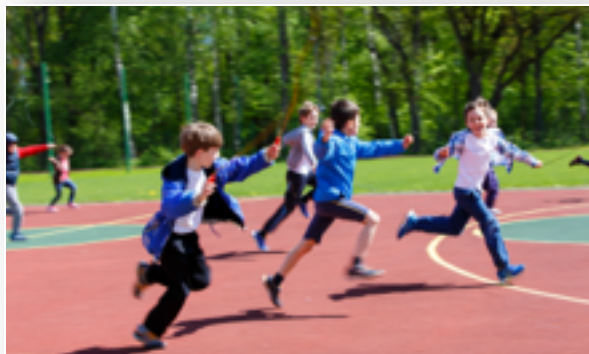
Мамы и папы с детьми школьного возраста 35 - 50 лет