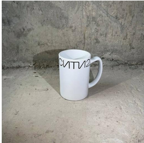
Фото реализованной продукции