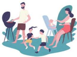
Наша ЦА: семейная аудитория