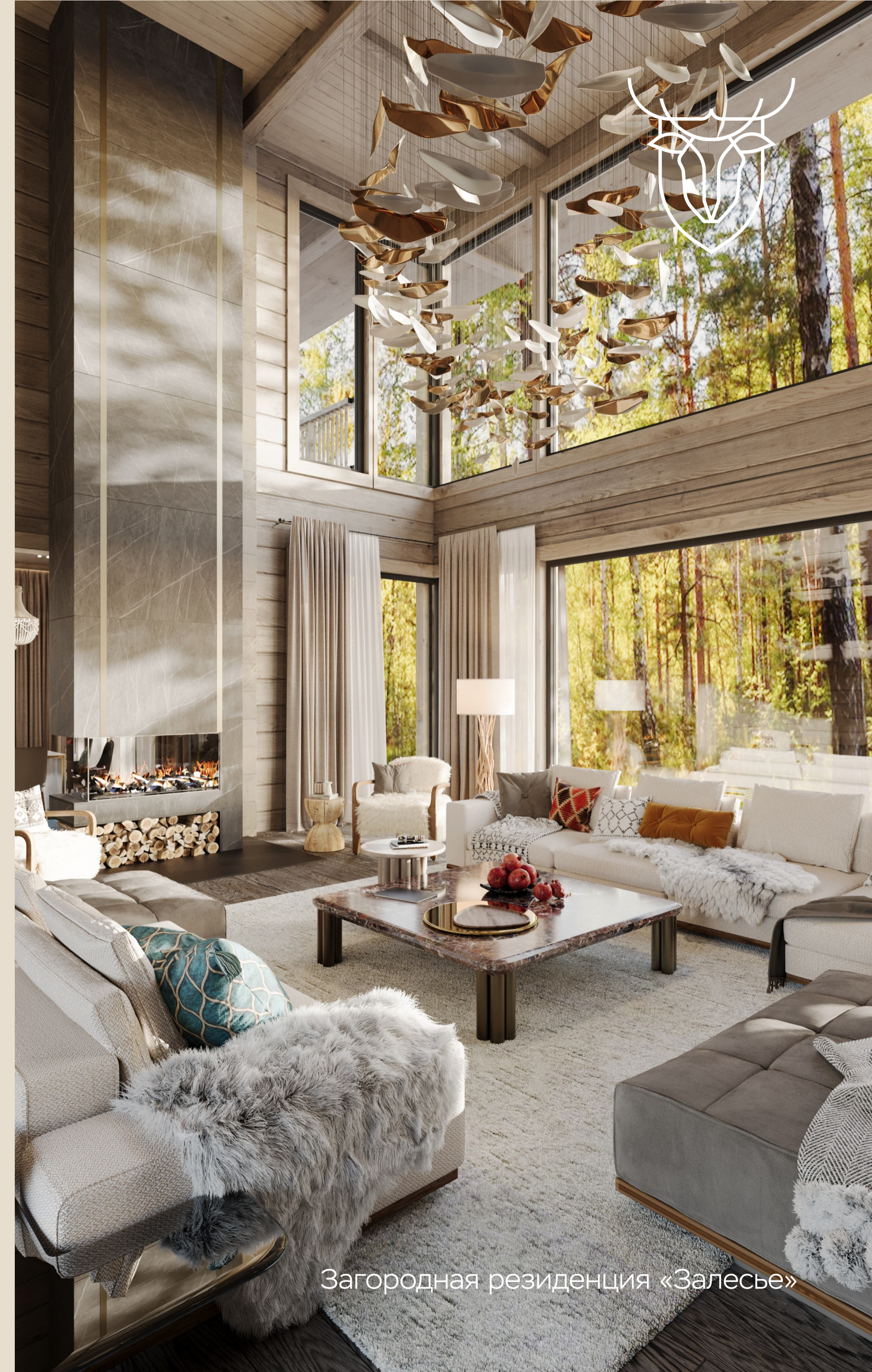
Загородная резиденция «Залесье»

Это способствует более качественному взаимодействию между сторонами и повышает шансы на успешное заключение сделки. Также мы отметили, что клиенты активно делятся промо-роликом с членами семьи и родственниками, которые являются ЛПР и ЛВР в процессе покупки дорогостоящей недвижимости.