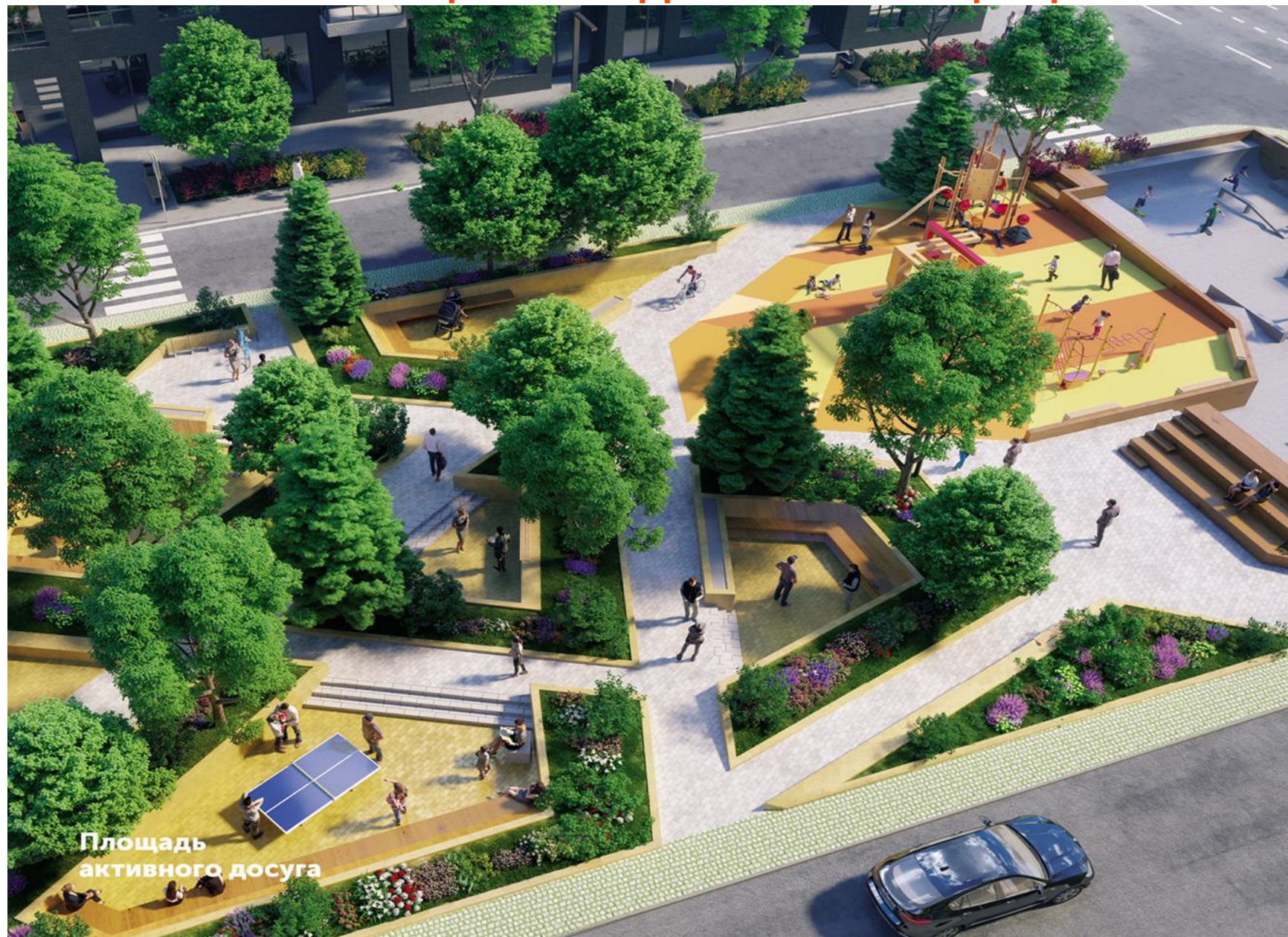
Площадь активного досуга

Новый формат креативной концепции полиграфии ФСК