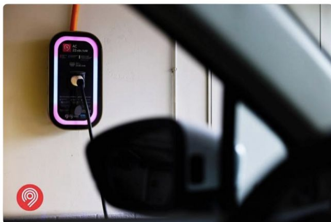
Зарядки для электромобилей на паркингах Москвы

Компания MR Group совместно с Департаментом транспорта Москвы и ООО «Интермобилити.ЕВа» запустили совместный проект по установке станций зарядки для электромобилей. Проект создан с целью развития легкового электротранспорта и городской зарядной инфраструктуры.