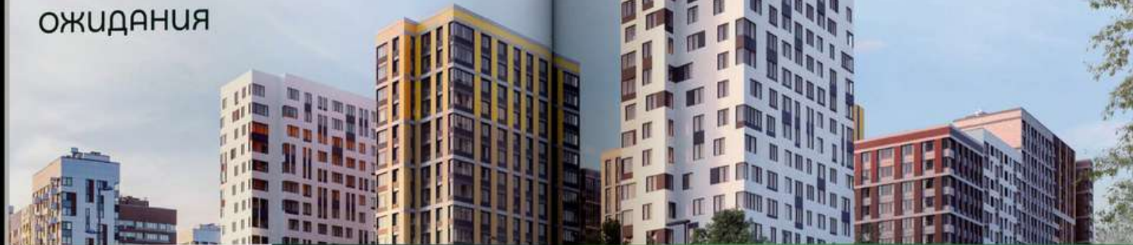
Микрорайон «В лесу» в цифрах

Микрорайон «В лесу» — это проект комплексного освоения территорий, часть которого уже построена.