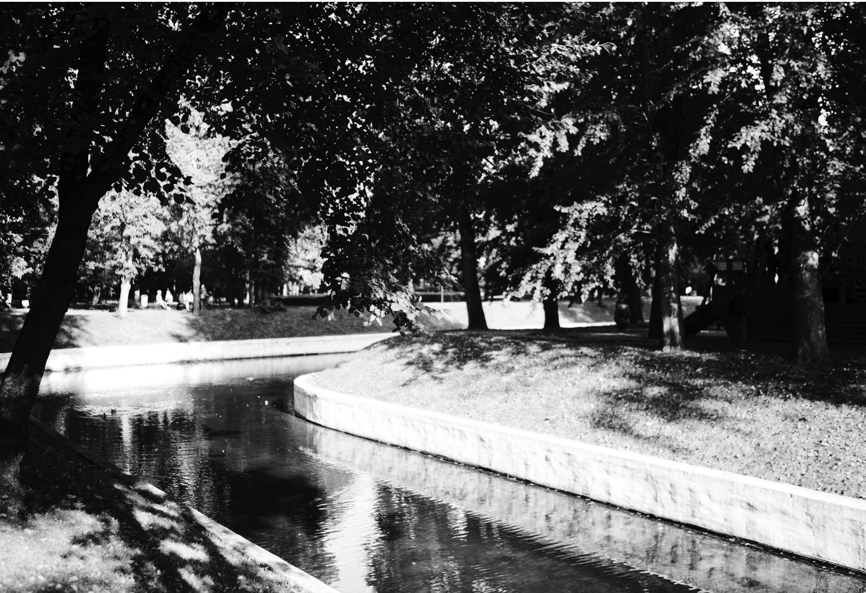
ПАРК В УСАДЬБЕ ТРУБЕЦКИХ