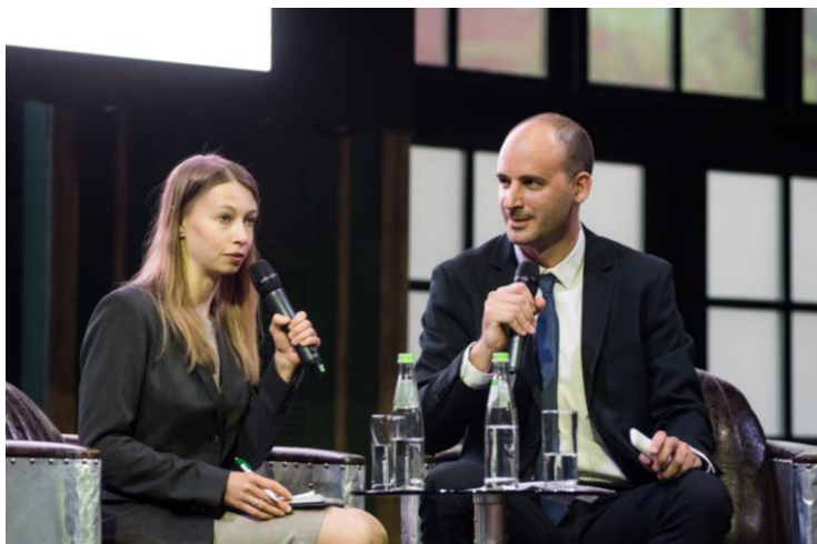
Алексис Пейе – архитектор, руководитель проекта французского бюро MICHEL REMON & ASSOCIES