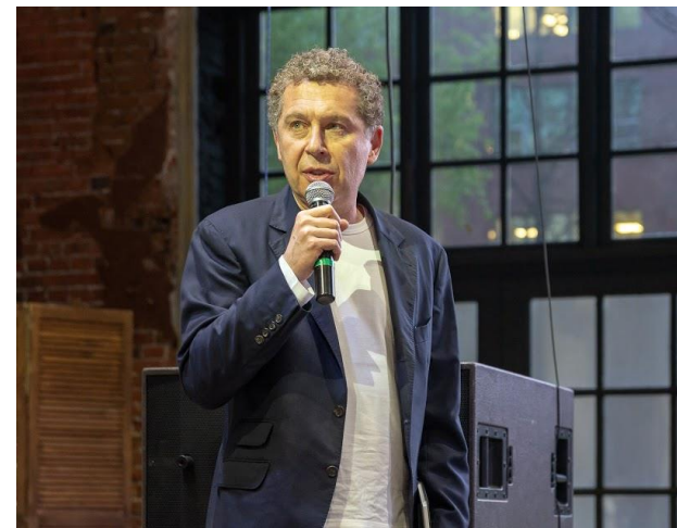
Александр Мамут – Управляющий акционер медиахолдинга Rambler & Co, председатель попечительского совета Института "Стрелка" и давний болельщик "Торпедо"