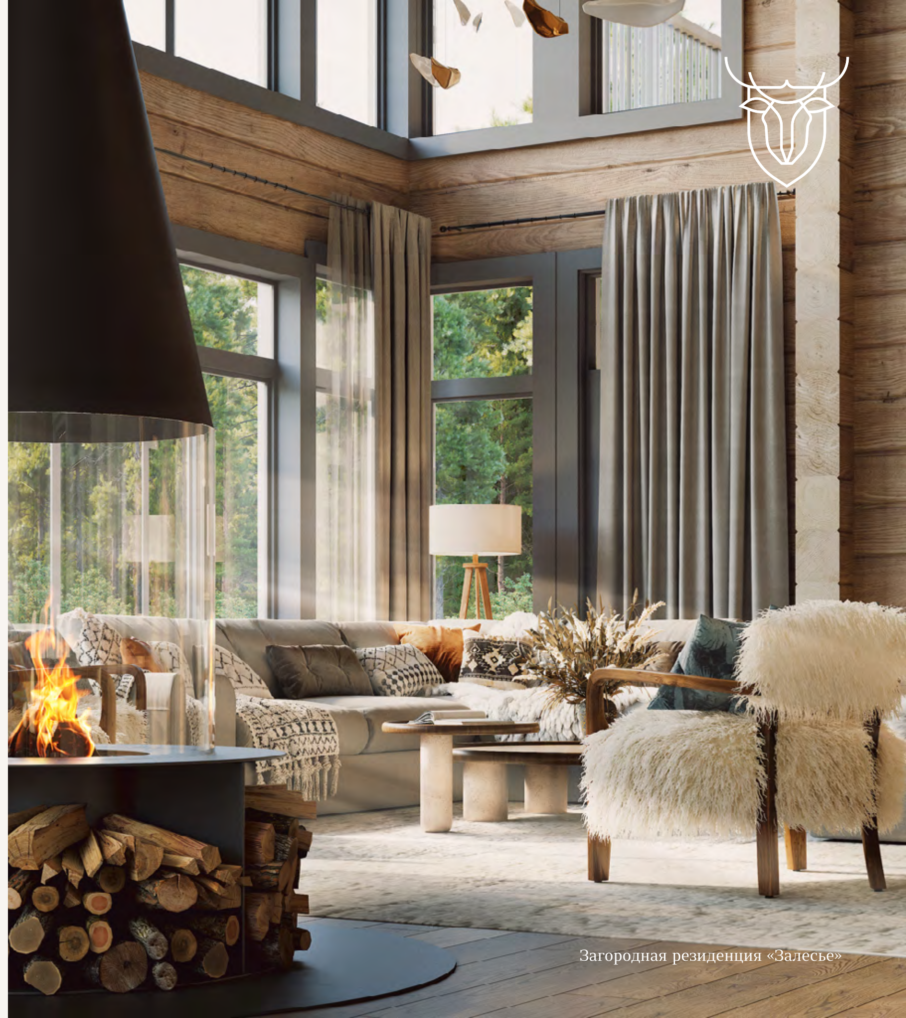
Загородная резиденция «Залесье»