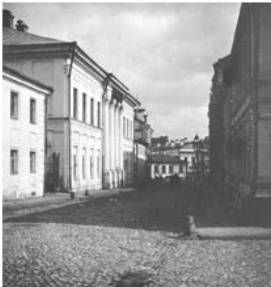
ХЛЕБНЫЙ ПЕРЕУЛОК ОТ УГЛА ЧАШНИКОВА ПЕРЕУЛКА