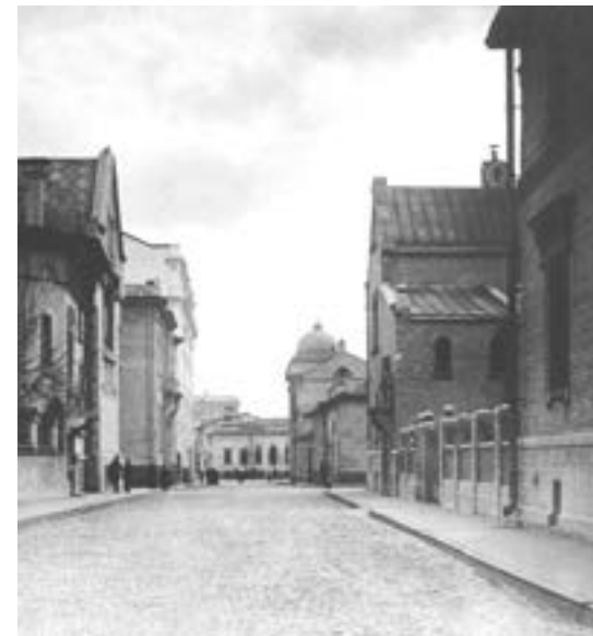
М. РЖЕВСКИЙ ПЕРЕУЛОК