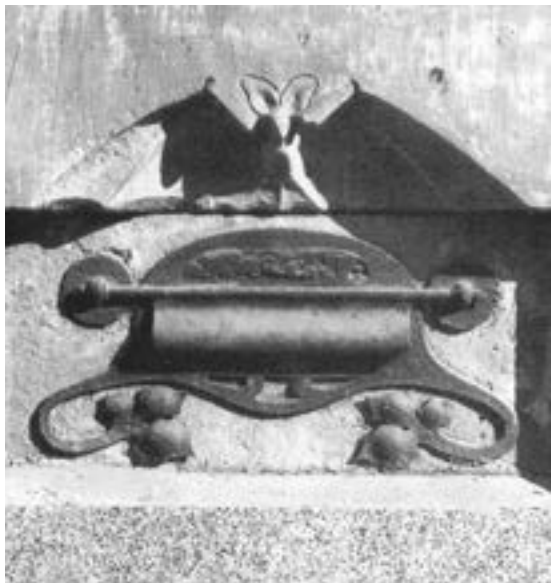
ПОЧТОВЫЙ ЯЩИК ДОМА СОЛОВЬЕВА М. РЖЕВСКИЙ ПЕРЕУЛОК, 6