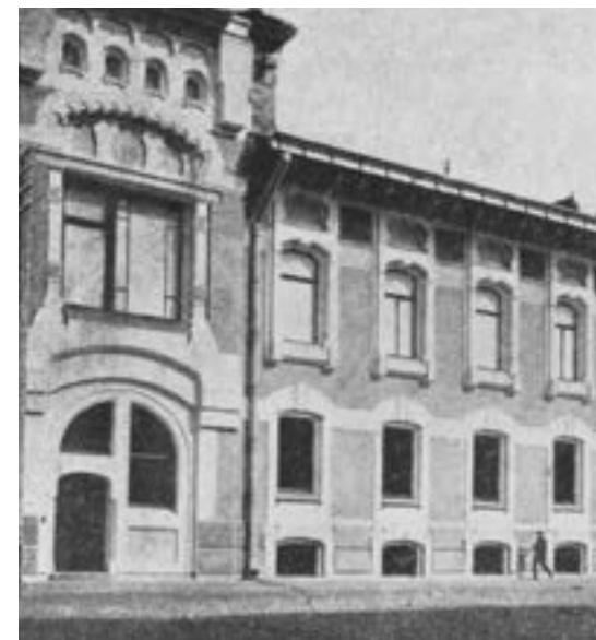
ОСОБНЯК СААРБЕКОВА АРХИТЕКТОР: Л. Н. КЕКУШЕВ ПОВАРСКАЯ УЛИЦА, 24

Но дом 24 по Поварской был достаточно скромным и робким экспериментом по сравнению с особняком Миндовского на Поварской, 44 (1903-4), где Кекушев по-настоящему развернулся.