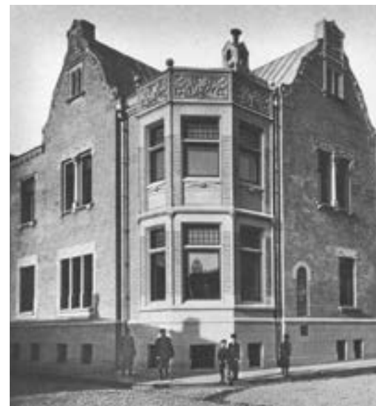
ОСОБНЯК И. И. НЕКРАСОВА НА УГЛУ МАЛОГО РЖЕВСКОГО И ХЛЕБНОГО ПЕРЕУЛКОВ