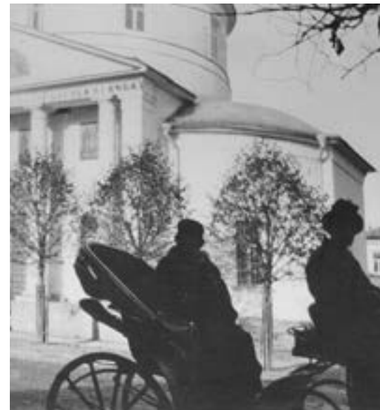
ПОВАРСКАЯ УЛИЦА ЦЕРКОВЬ БОРИСА И ГЛЕБА