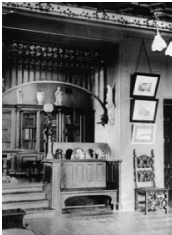
ГОСТИНАЯ В ДОМЕ СОЛОВЬЕВА М.РЖЕВСКИЙ ПЕРЕУЛОК, 6