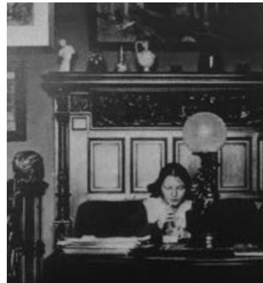
ИНТЕРЬЕР КАБИНЕТА АРХИТЕКТОРА СОЛОВЬЕВА