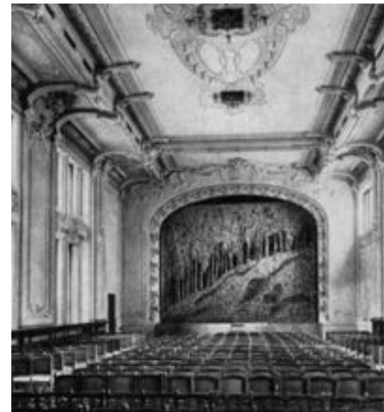
ЗАНАВЕС РАБОТЫ В.Э.БОРИСОВА-МУСАТОВА С ИЗОБРАЖЕНИЕМ ТАРУССКОГО ПЕЙЗАЖА. МЕРЗЛЯКОВСКИЙ ПЕРЕУЛОК, ДОМ 1

Тогда подобное сорище казалось отчаянной затеей – даже депутаты не брались предполагать, что спустя каких-то 12 лет вся власть и вправду перейдет к Советам, а в аристократические особняки начнут перебираться наркоматы (у Сталина на Поварской было два кабинета – под номером 11 и под номером 52).