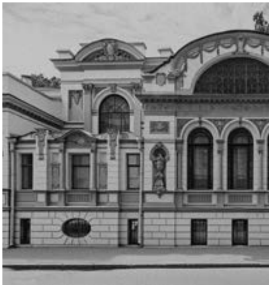
ДОМ АРАКЧЕЕВА ПОВАРСКАЯ УЛИЦА, 9