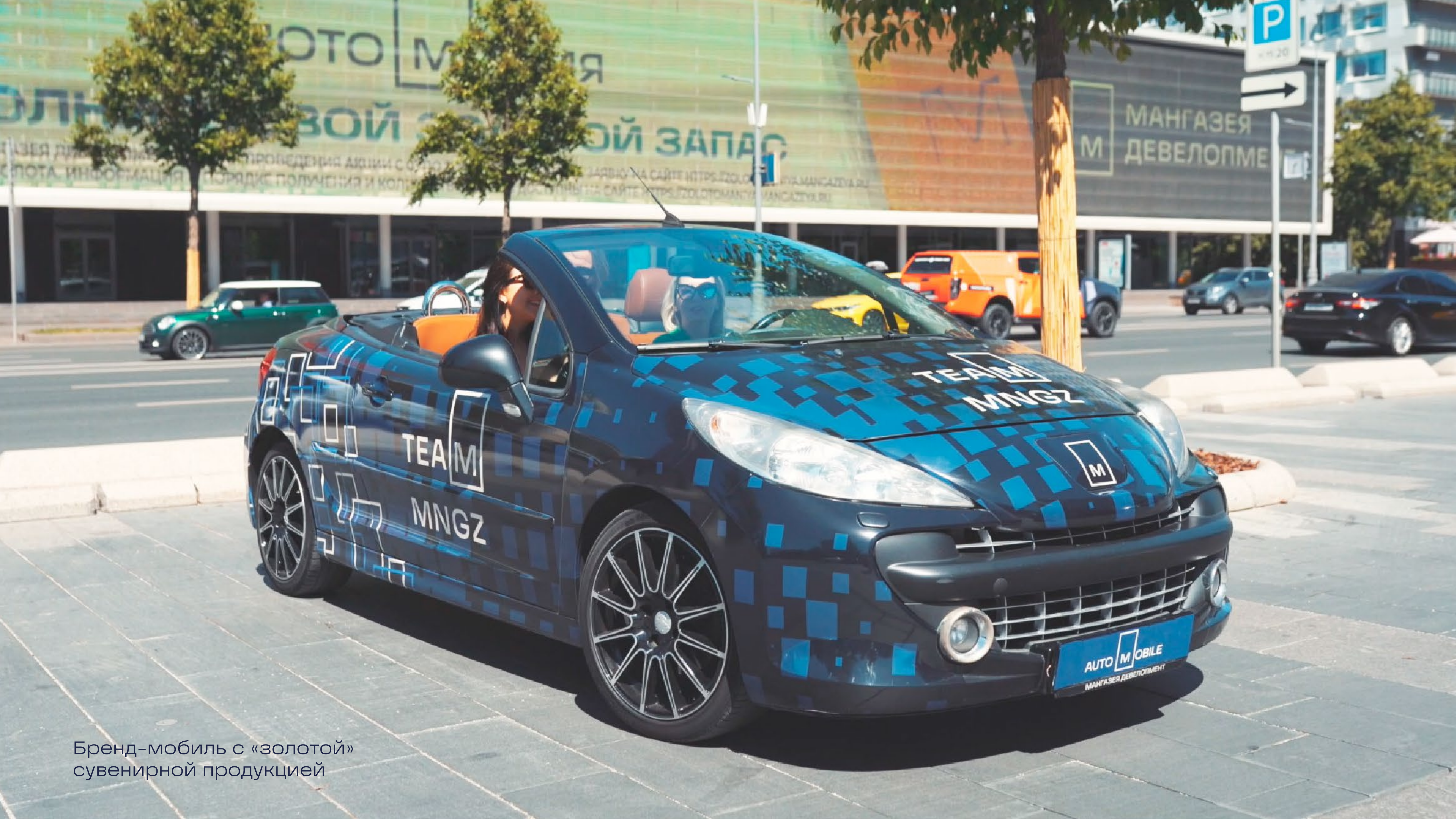
Бренд-мобиль с «золотой» сувенирной продукцией