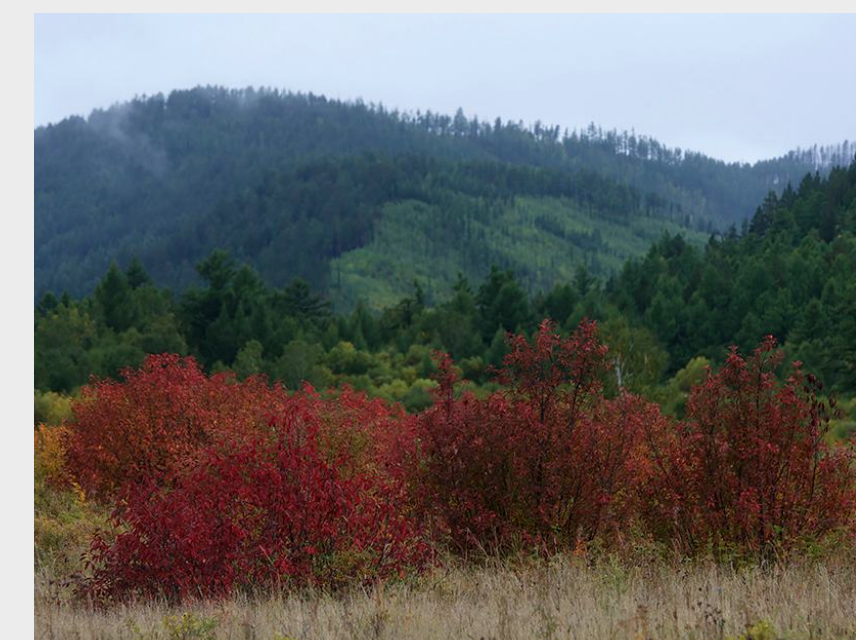
Национальный парк Алханай