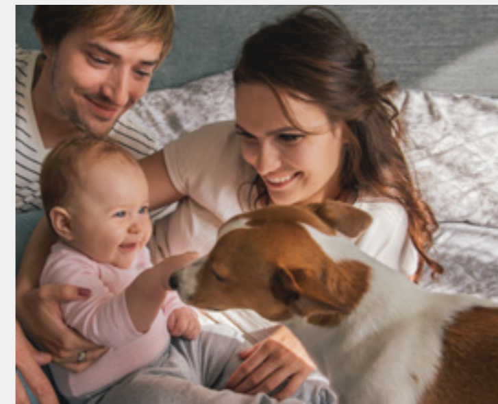
Семья с маленьким ребенком