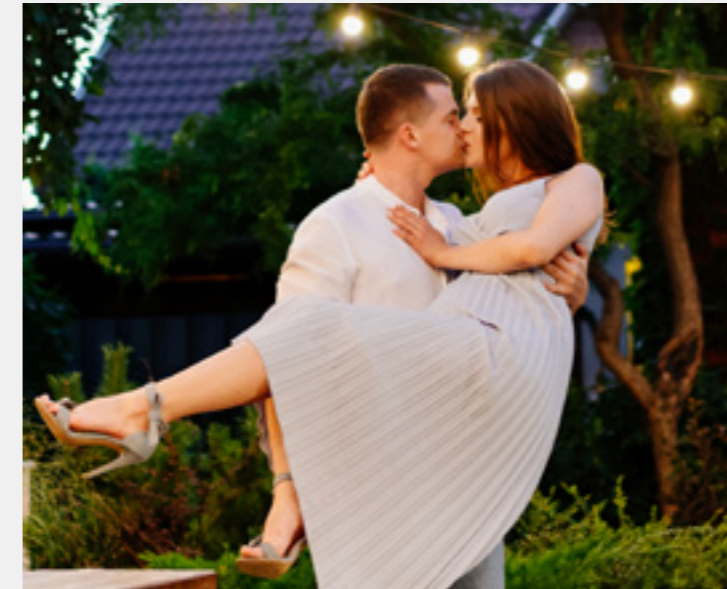
Молодая семья без ребенка