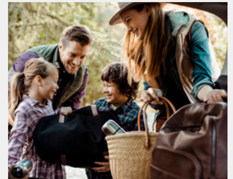
Семья с детьми от 7 до 18 лет