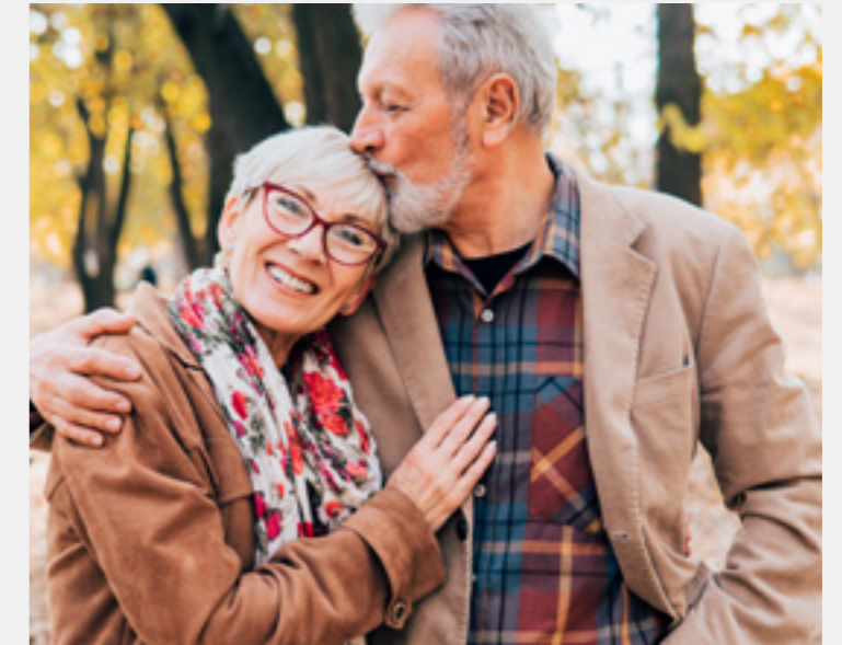
Взрослая семья (есть внуки)