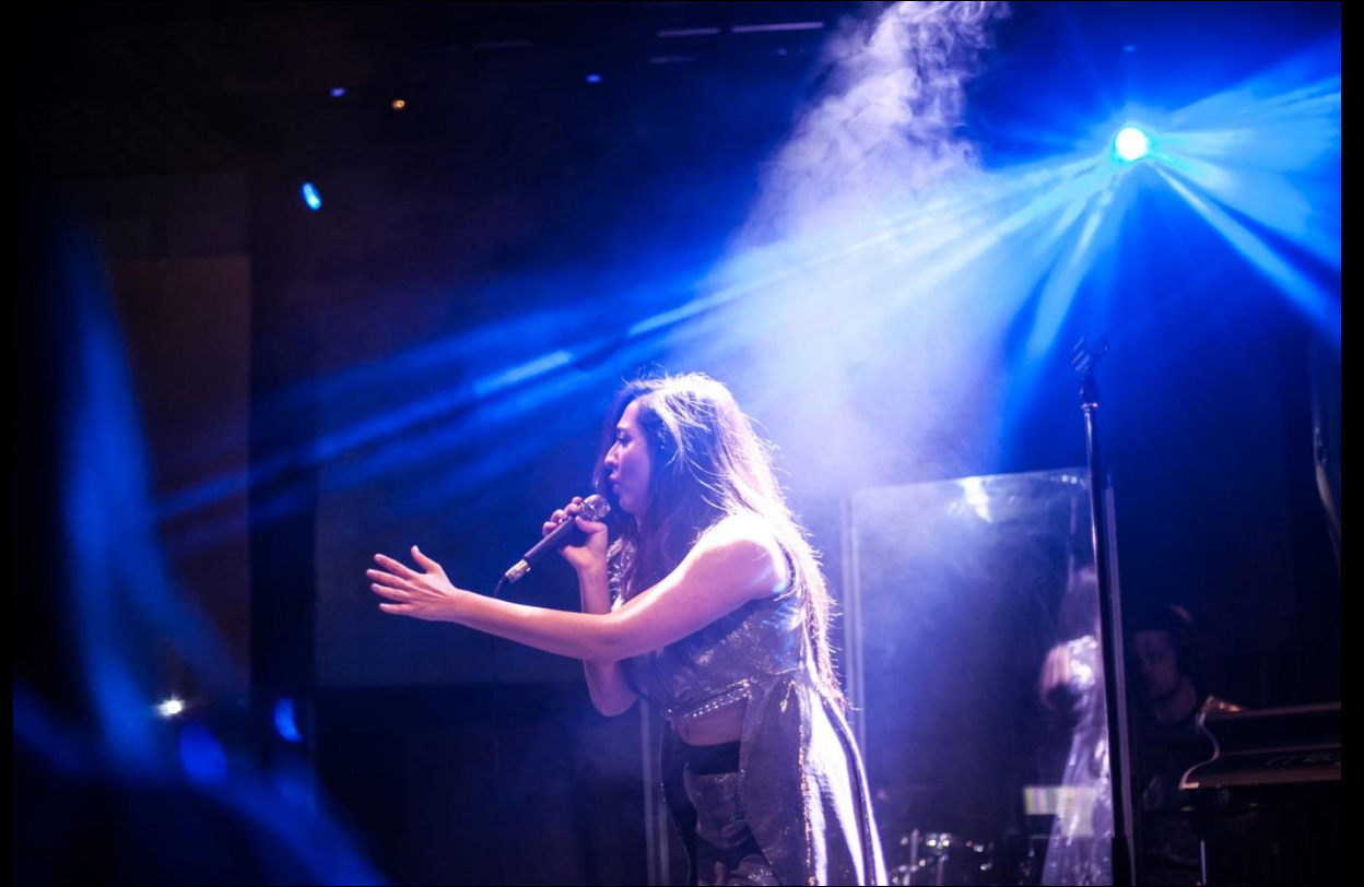
Музыкальный Headliner вечера – певица Manizha